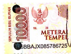
Wahyu Nurhadi Pratomo